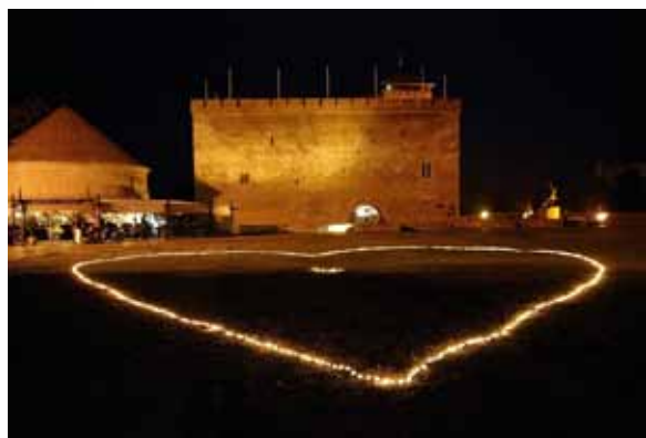
A programváltozás jogát fenntartjuk!

Gyulán minden nap varázslatos hangulat uralkodik! A város egészségét és nyugalmat sugároz mediterrán hangulatú korzójaival, szökőkútjaival, sétára hívogató árnyas parkjaival. Gyula a lélek egészségére is kiemelt figyelmet fordít, hiszen színes kulturális élete páratlan természeti környezete felüldülésre nyújt minden korosztály számára. A test és lélek kényeztetésére kiváló lehetőséget teremt a Gyulai Várfürdő értékes gyógyvize, hangulatos wellness központja, Castello Szaunaparkja, valamint Beauty Masszázs Szalonja. A gasztronómiai élvezetnek hódolók számára felejthetetlen élményt nyújt a Százéves Cukrárszda kézzel készített bonbonja, a gyulai kolbász fenséges íz-kavalkádja és a Gyulai Pálinka Manufaktúra zamatos pálinkája. Keresse programjainkat a Tourinform Irodában.